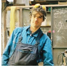
SCENOGRAPHIE, DECOR Jérôme RICH, artiste visuel