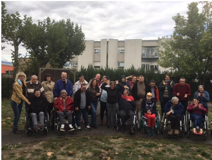
Pot avec les participants du Projet Triple Je

Des pistes sont évoquées pour la suite : pourquoi ne pas imaginer une tournée du spectacle Triple Je dans d'autres établissements ?