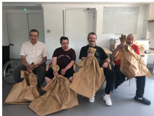
Répétitions marionnettes