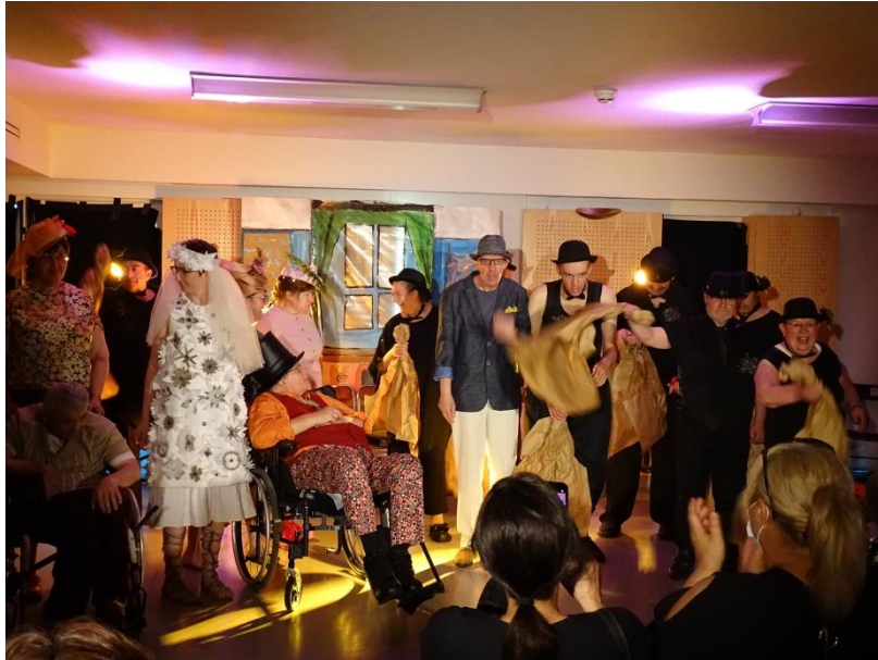
Représentations du 04 juin

Florence et le groupe "Costumes" finalisent la robe de mariée.