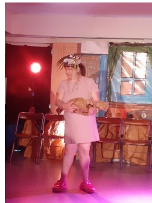
Répétitions du 03 juin Danse avec les marionnettes en papier Les marionnettes en papier

Le groupe essaye une chorégraphie dynamique pour clore la journée.