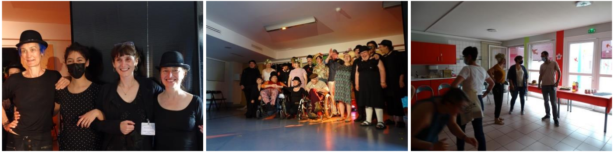
Equipe A/M du 04 juin

Cette belle aventure restera dans la mémoire des artistes de la compagnie comme un temps de créativité et de rencontres exceptionnelles