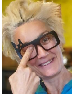
COSTUME Florence BONHERT, Costumière