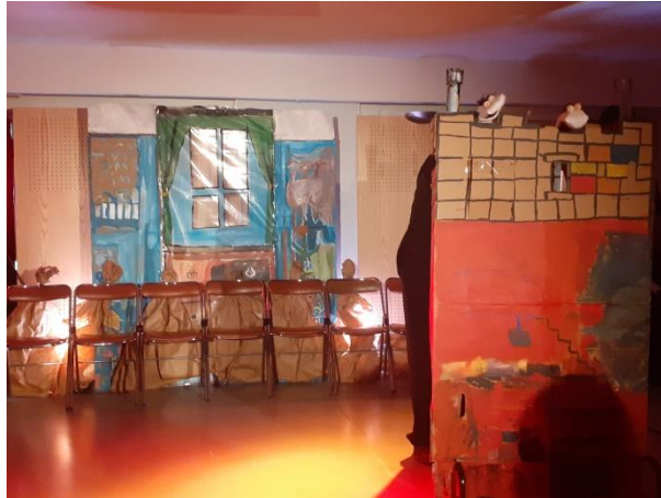
©Aurélie MAUVISSEAU – Répétitions du 03 juin Marionnettes et Sténographie du spectacle Tripe Je

Les répétitions vont se faire progressivement dans la salle de repas où le spectacle sera joué.